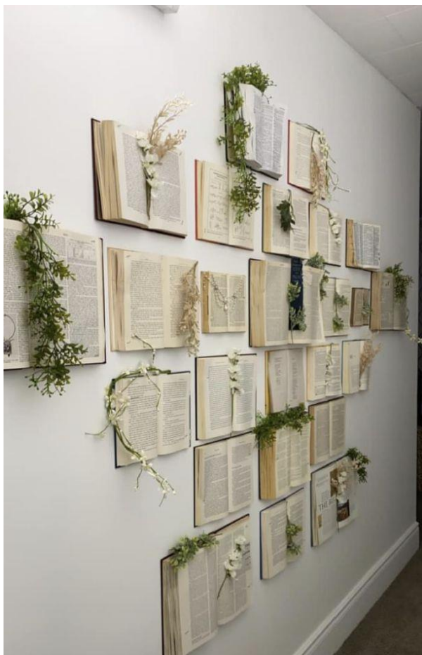
Foto 3. Raamatute taaskasutamine interjööris. Adele Turnbull. Pinterest

Kui kujutis on võetud veebiplatvormilt (nt Pinterest) ja on teada kujutise autor, tuleb viidata allkirjastamises mõlemale (vt. Foto 3 allkirjastamist). Kui veebiplatvormil on viide kujutise originaalasukohale, tuleb asukoht kontrollida, kinnitada ning viidata tuleb kujutise originaalasukohale.