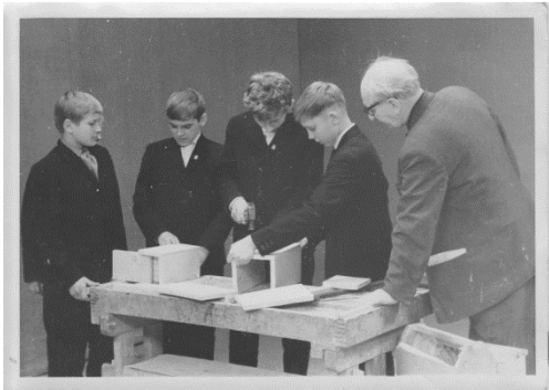
Foto 3. Tööõpetuse tund Laitse Algkoolis. Pildi tegemise aega ei olnud võimalik täpselt määratleda.