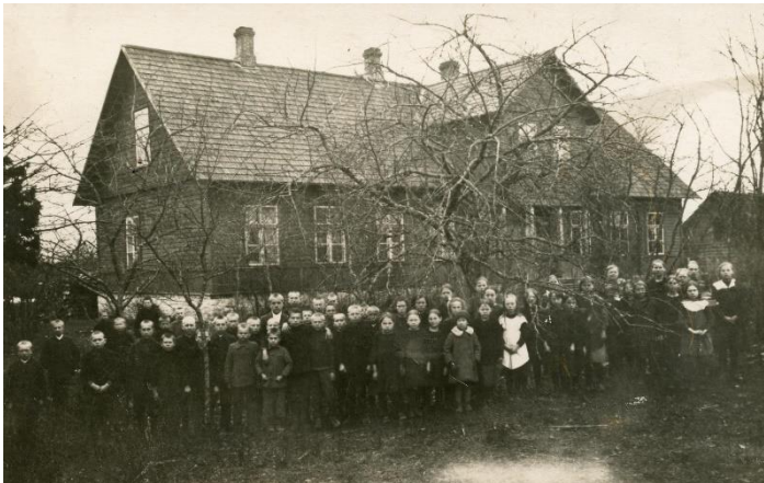
Foto 1. Õpilased ja õpetajad Laitse algkooli hoone ees. Pilt tehtud ajavahemikus 1920-1930