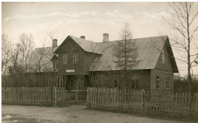
Foto 2. Laitse algkooli hoone. Pilt tehtud 1920-1930