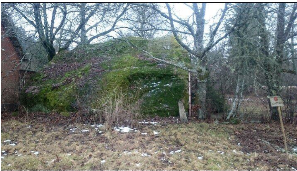
Lossikivi. Autor:Elena Niidas. Elena Niidase erakogu.